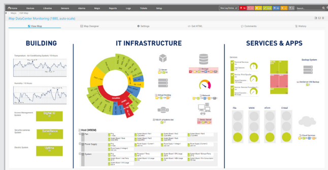
您的数据中心一览